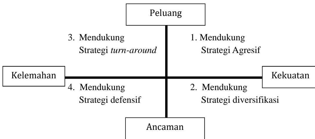
Gambar 1. Analisis SWOT

Analisis SWOT membandingkan antara faktor eksternal peluang dan ancaman dengan faktor internal kekuatan dan kelemahan. Faktor internal dan eksternal yang sudah diidentifikasi dibandingkan dalam kuadran-kuadran untuk memudahkan analisis, seperti yang terinci pada Gambar 1.